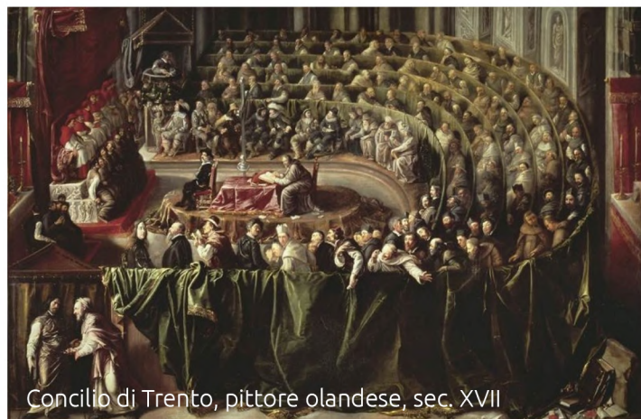
Concilio di Trento, pittore olandese, sec. XVII

Nello stesso tempo definiva gli effetti del Sacra-