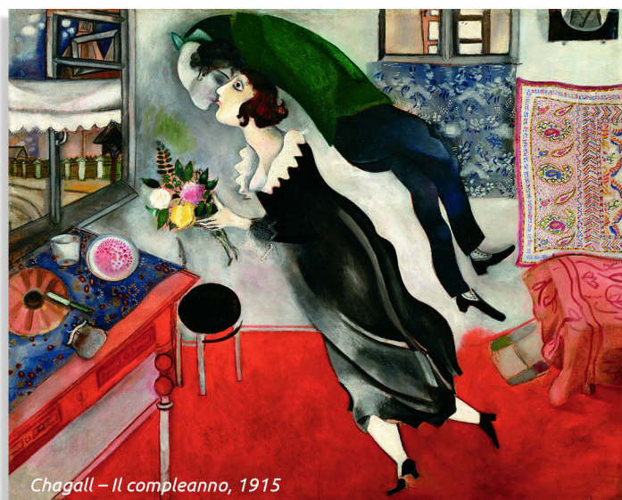
Chagall - Il compleanno, 1915

L'Amore coniugale va, quindi, vissuto come