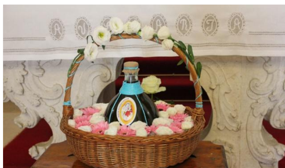
Olio votivo offerto dalla Parrocchia