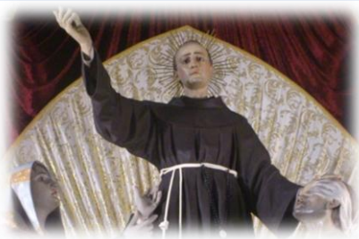
San Salvatore da Horta, la novena