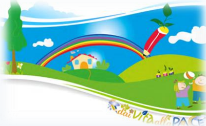
ACR, Festa cittadina della Pace