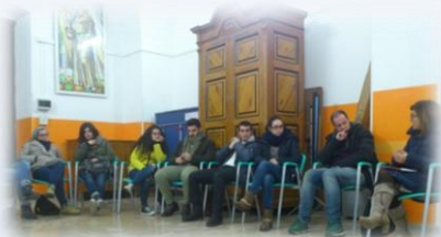
Azione Cattolica, incontro Giovani: il cristiano "antenna" della società